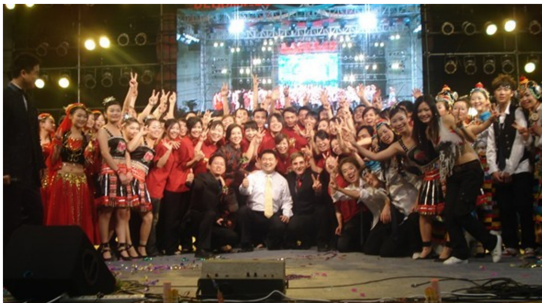
广东二手塑料进口托盘商帮群体总结年会 2012 年秋季第 5 届会议：